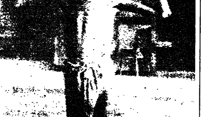
تضرع الى السماء